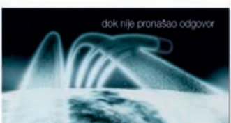
dok nije pronašao odgovor