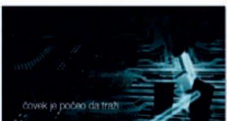
čovek je počeo da traži