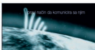
pravi način da komunicira sa njim