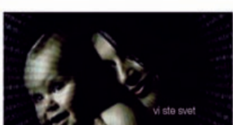
vi ste svet