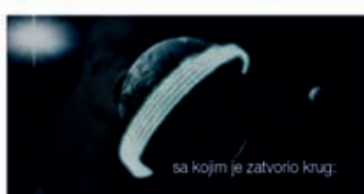
sa kojim je zatvorio krug.